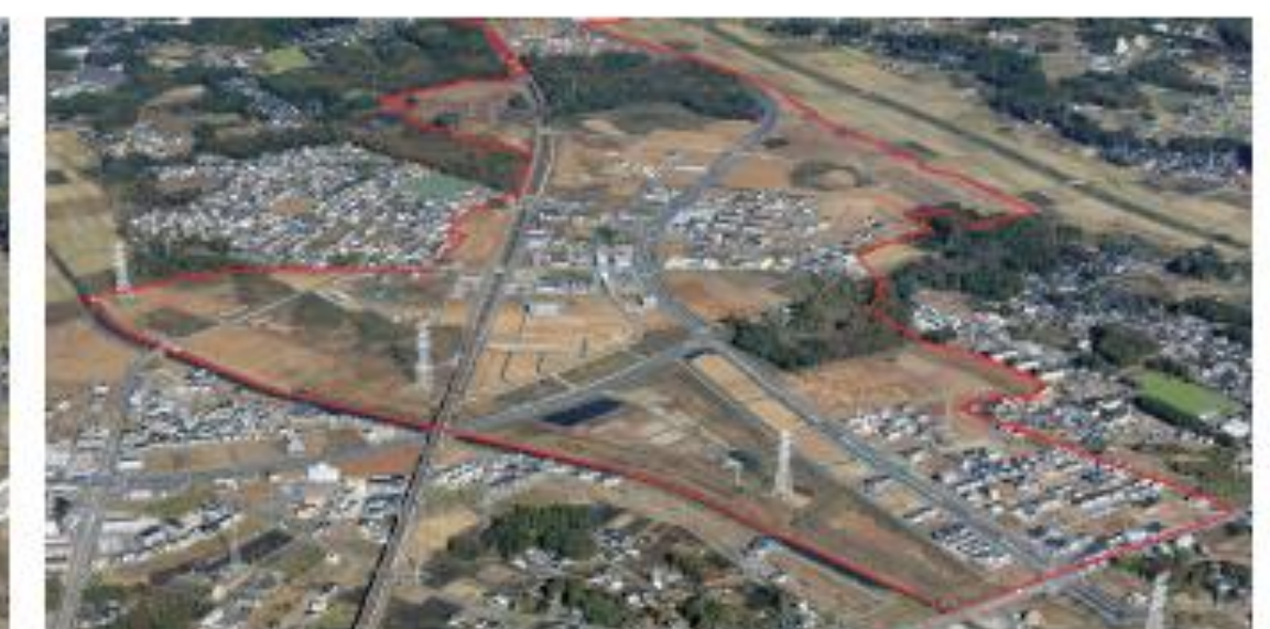
島名・福田坪地区(南部) 平成29年11月撮影