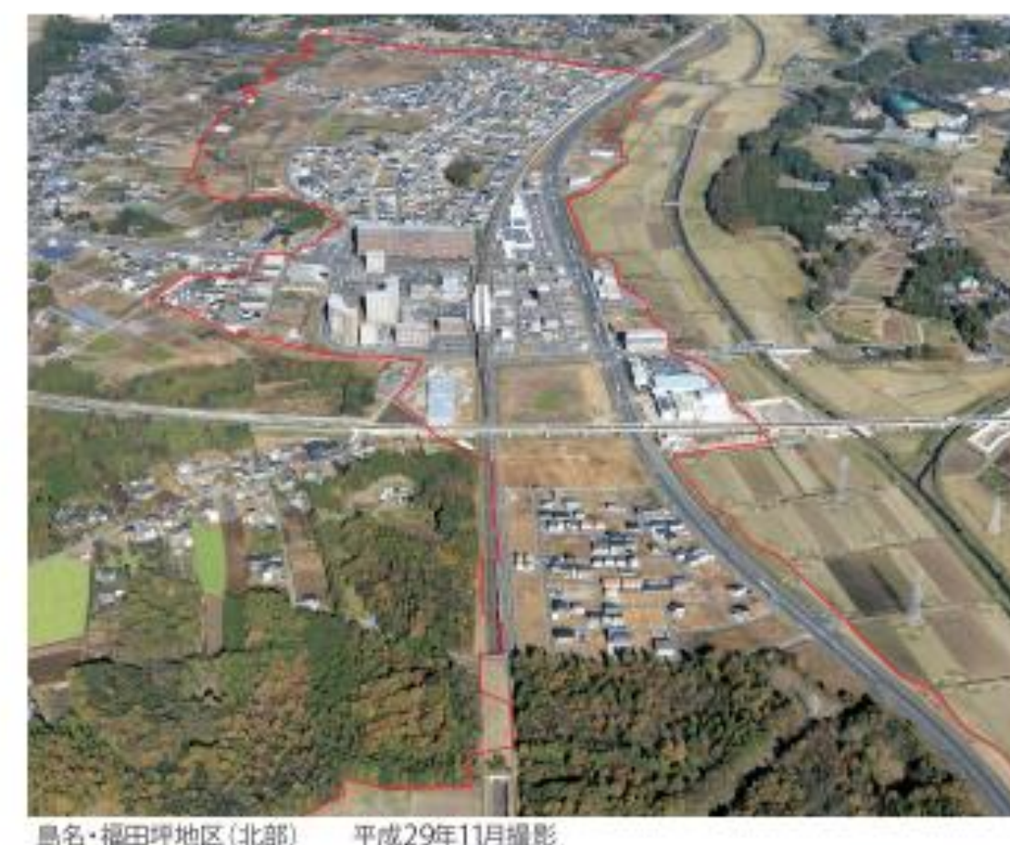
島名・福田坪地区(北部) 平成29年11月撮影

注1 上記は現時点の予定です。今後変更となる場合があります。 注2 敷地の分割が可能な場合があります。詳細についてはお問い合わせください。 注3 媒介制度 ○: 売却、貸付 △: 売却のみ、-: 媒介対象外 注4 原則として、土地処分は売買となっております。 (参考) ※1 個人向け宅地分譲実績(H29.10) 分譲単価: 平均約5.3千円/m 2 ※2 個人向け宅地分譲実績(H29.6) 分譲単価: 平均約5.7千円/m 2 ※3 商業・業務用地分譲実績(H28.5) 分譲単価: 約7.2千円/m 2 分譲面積: 3,310m 2 ※4 商業・業務用地分譲実績(H28.7) 分譲単価: 約9.0千円/m 2 分譲面積: 21,680m 2